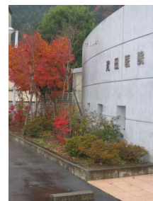
写真: 細浦・滝田医院の正面 紅葉がきれいでした。

●保険診療は必ず診察が 必要です。これは法律で 決まっています。毎回薬 だけでは困ります。