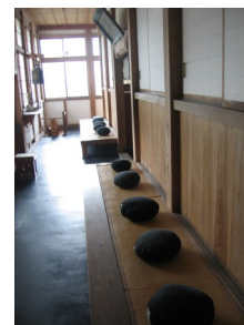
奥の正法寺（奥州市）の座禅道場

りません。医者や薬局は儲けていいなと思いますか？ 医者も薬剤師も、保険を使っても使わなくとも、入る金は同じ3千円なのです。患者さんが払った千円のほかに残り2千円は国保連や支払基金から貰っています。薬を無くした時の自費というのは患者さんが全て3千円を払うという理屈です。くれぐれも薬はなくさないで下さい。また自分で勝手な飲み方は止めてください。それで薬が足りなくなる場合もあります。