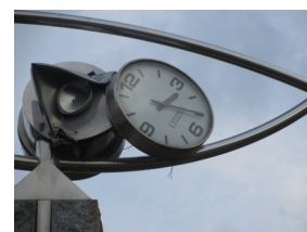
大船渡町茶屋前の時計台

復旧・復興は画一的ではいけない。三陸各地の事情がある。また地域も黙って施策に従うのではなく、自分たちの声を発するべきではないか。時計台はそう言っている気がします。