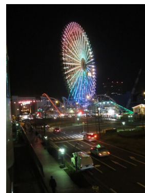
会場のみなとみらい夜景

●保険診療は必ず診察が必要です。これは法律で決まっています。毎回薬だけでは困ります。