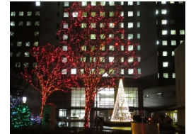
仙台厚生病院の夜景

月上旬頃から)から薬を飲むやり方です。こうすれば点鼻薬や点眼薬は使わなくて済むことが多いようです。また以前にも書きましたが、花粉症の薬の効き方には個人差があります。ある人には効いても別な人には効かない場合もあります。じぶんにあった薬を医者と一緒に探しましょう！